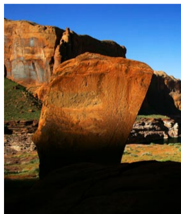
Fantastisk natur finns i Grand Canyon