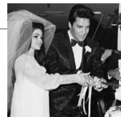
Elvis och Priscilla 1967.

Frank Sinatra blev i Vegas 60-talets mest lysande artist. Elvis och Priscilla gifte sig 1967 i hotell Aladdin och Elvis regerade här på 70-talet.