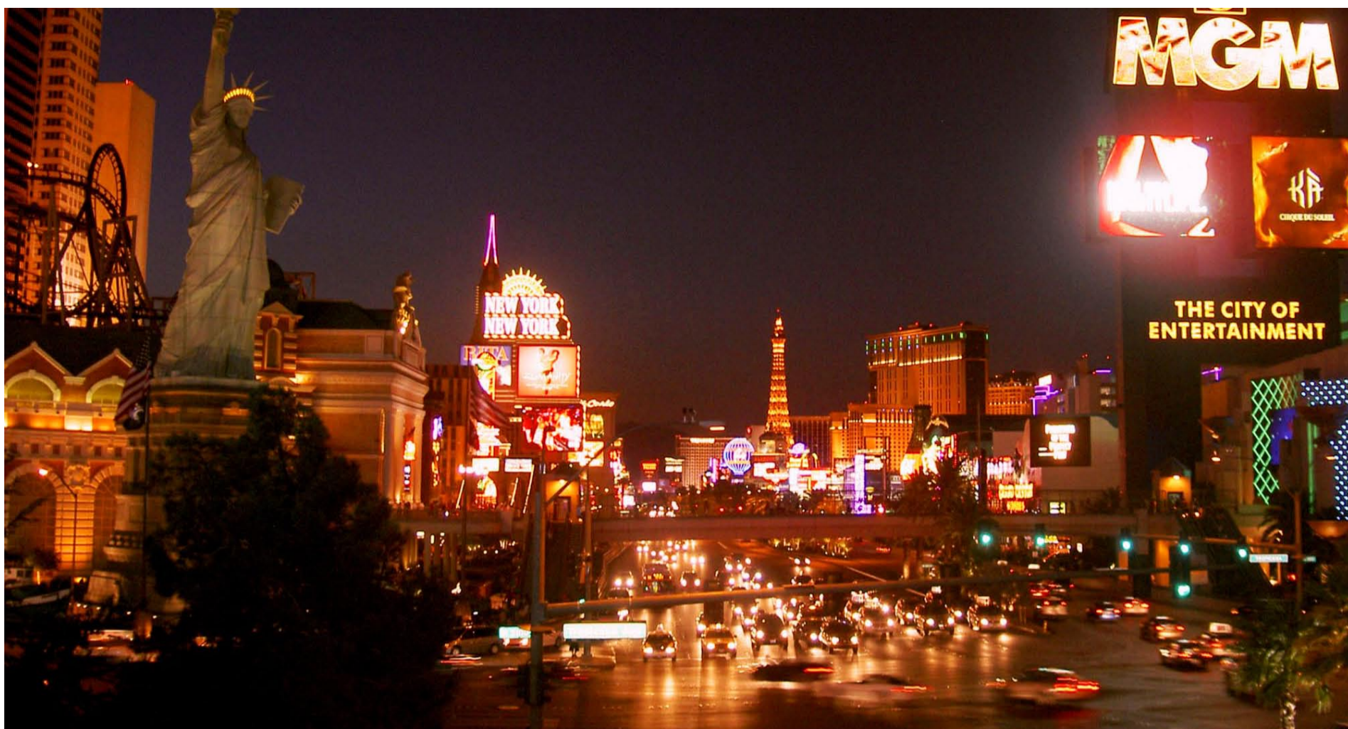
Las Vegas klassiska huvudgata The Strip. I Vegas kan man förstås bränna mycket pengar men det kan också vara platsen för en lågbudgetsemester.