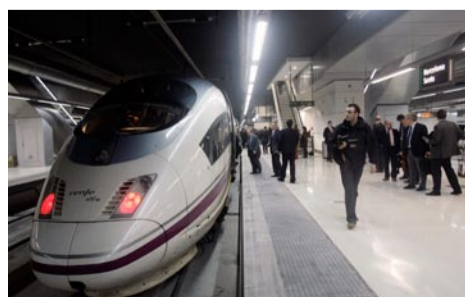
Höghastighetståget redo i Barcelona.