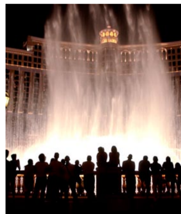
Bellagios fontän lockar många åskådare.