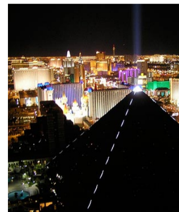
Utsikten är hänförande från Mix överst på THEhotel.