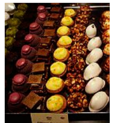
Läckra godsaker och bakverk finns det gott om.