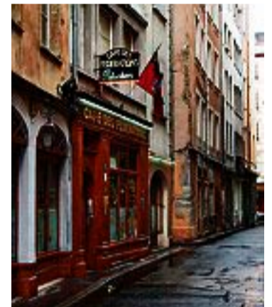
Café des Federations serverar husmanskost och traktens vin.